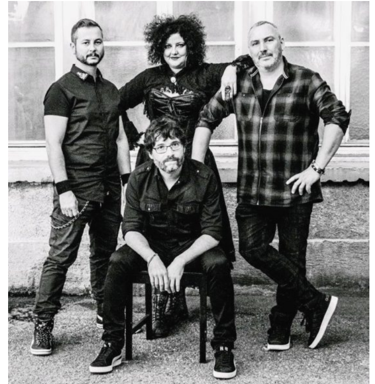
Les Francs-Montagnards et Jurassiens bernois du Serge Band ont tiré parti du confinement pour se produire – presque – en live. Les quasi-Prévôtois d'Exess, eux, font la promo de leur première galette.